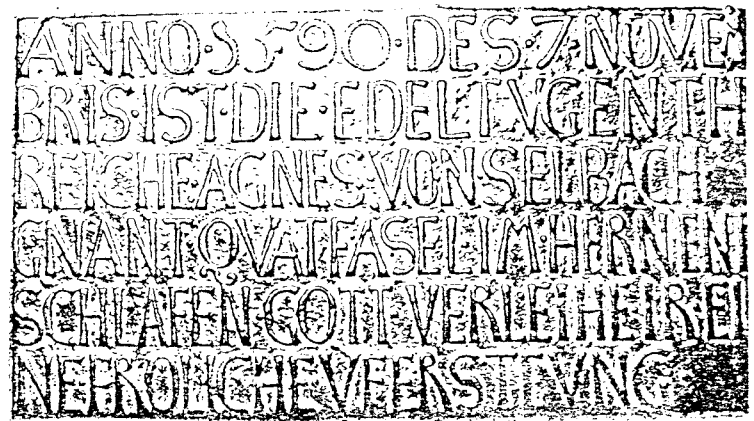
ANNO 1590 DES 7. NOVEMBRIS IST DIE EDEL TUGENTREICHE AGNES VON SELBACH GNANT QUATFASEL IM HERN ENTSCHLAFEN GOTT VERLEIHE IR EINE FRÖLICHE UFERSTEHUNG

Aus der Epitaphien - Sammlung der Stiftskirche zu Keppel: Teilansicht der Eisenguß - Grabplatte einer Zeppenfelder Adelligen