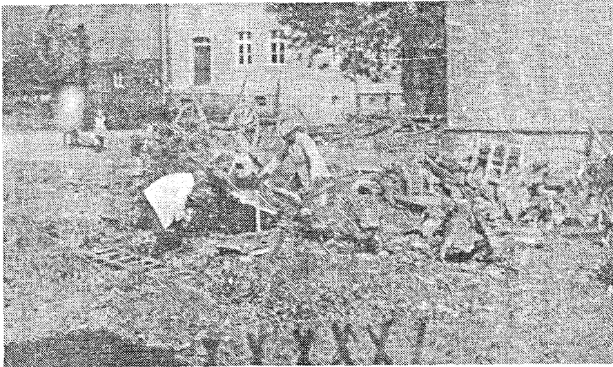
Diese Aufnahme vom 21.6.1928 zeigt deutlich den morschen, ausgehöhlten Stamm der alten Linde, der auf ein hohes Alter schließen läßt