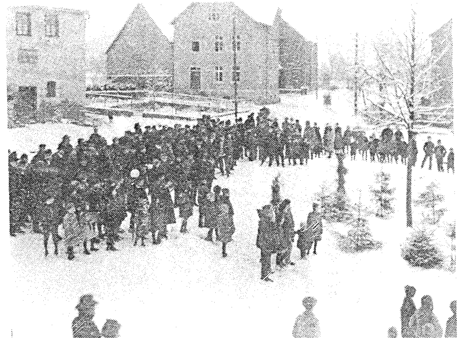
Aufnahme vom 15.12.1928: Einweihung der neuen Linde

-allein durch seine Sitte kann er frei und mächtig sein".